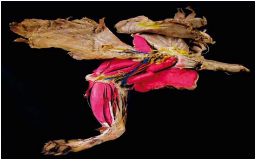
Figura 5. Miembro anterior izquierdo (canino)