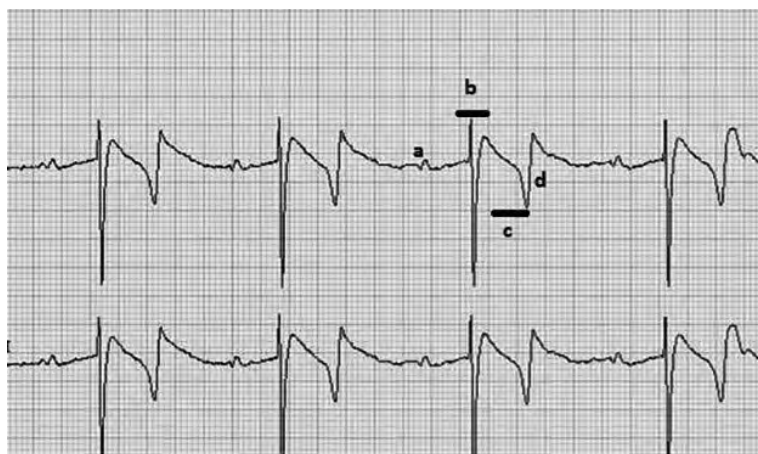
Figura 3. Electrocardiograma con derivación base ápex

Nota. Se pueden visualizar las diferentes ondas: a) onda P, b) complejo QRS, c) segmento ST y d) onda T.