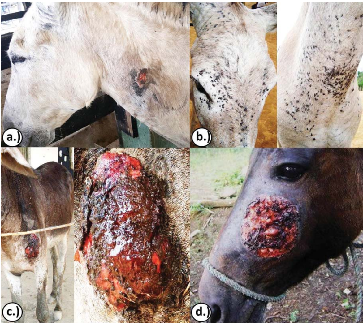
Figura 1. a) Herida traumática; b) dermatofitosis; c) sarcoide fibroblástico; d) habronemosis