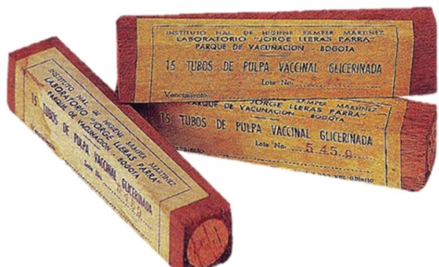
Figura 5. Vacuna antivariólica del Instituto Nacional de Higiene Samper Martínez. Laboratorio Jorge Lleras Parra, Parque de Vacunación, Bogotá. Cada tubo alcanza para 20 personas y una vez abierto debe emplearse toda la vacuna. Debe conservarse en lugar fresco, ojalá en nevera, y emplearse lo más pronto posible (7).

el diseño de los establos, la higiene de las superficies y la elección de las terneras, y la refrigeración prolongada de las pulpas glicerizadas (1).