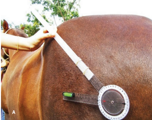
Figura 1. a) Determinación del ángulo de grupa utilizando un goniómetro con un nivel de burbuja acoplado. b) Determinación del tipo de inserción de cola utilizando una regla metálica de 60 cm con un nivel de burbuja acoplado